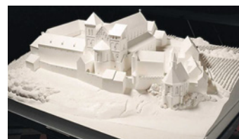
Klostermodell im Museum am Strom

Ab etwa 1150 entstand am Rupertsberg das Hildegard-Kloster mit der dreischiffigen Kirche im Zentrum. In ihren knapp 30 Rupertsberger Jahren verfasste Hildegard hier die meisten ihrer Werke, die im hiesigen Skriptorium auch kopiert und in alle Welt versandt worden sind. Die Tafel am Eingang zum »Rupertsberger Gewölbe« zeigt, wo die einzelnen Gebäude des im Jahr 1632 zerstörten Klosters im heutigen Stadtbild zu verorten sind. Das »Rupertsberger Gewölbe«, das sich unterhalb des ehemaligen Kirchenschiffs erstreckt und an den Wochenenden für Besucher geöffnet ist, bietet als einzige verbliebene Stätte einen direkten Zugang zur historischen Anlage.