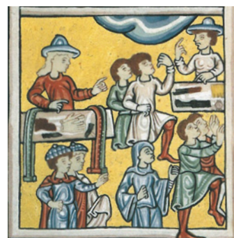
Marktszene mit Verkaufstischen und Händlern

Schon zu Hildegards Zeiten war hier der Marktplatz. Allerdings warnte die Seherin vor den Gefährdungen des Geschäftslebens, da es Gier und Hochmut und andere, allzu irdische Leidenschaften begünstigen würde. Aus dieser Haltung heraus, die im Mittelalter häufig in kirchlichen Kreisen gepflegt wurde, zeichnet Hildegard in einer Vision auch ein sehr negatives Bild des Markttreibens: „am verderblichen Reichtum entzündet sich nämlich Stolz und eitler Ruhm, an den vergänglichen Vergnügungen Übermut und Begierde und am Handels-