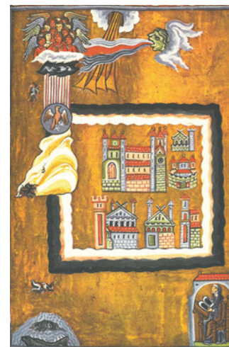
Vision von der ummauerten Stadt

am Rupertsberg bezog. Damals, als die ersten Städte am Rhein blühten, änderte sich vielerorts das bislang vorherrschende Bild offener Siedlungen. Die neuen Stadtmauern verkörperten den Wandel der Epoche und faszinierten die Zeitgenossen. Auch Hildegard beschreibt das Bild der ummauerten Stadt in mehreren Visionen ihres »Buches der göttlichen Werke«. Hier ist sie Symbol für das göttliche Gericht, das den Menschen nach ihren Verdiensten helle oder dunkle Stätten für die Ewigkeit zuweisen wird: „Und ich schau die quadratische Anlage einer großen Stadt, die auf allen Seiten von hellem Glanz und von Dunkelheit wie von einer großen Mauer umgeben war.“